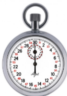
Секундомер механический СОПр-1В-3-000