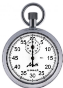
Секундомер механический СОПр-2А-3-000