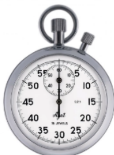
Секундомер механический СОСпр-2Б-2-000