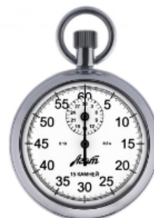
Секундомер механический СОПр-2А-2-010